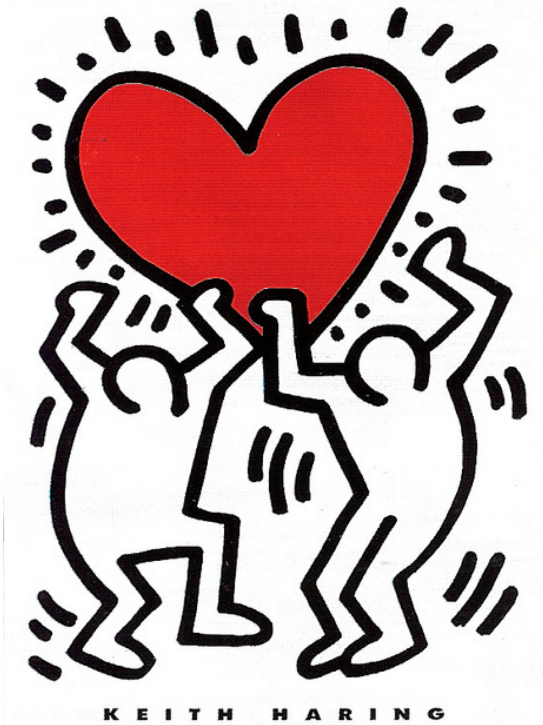
Keith Haring: Heart (1989)